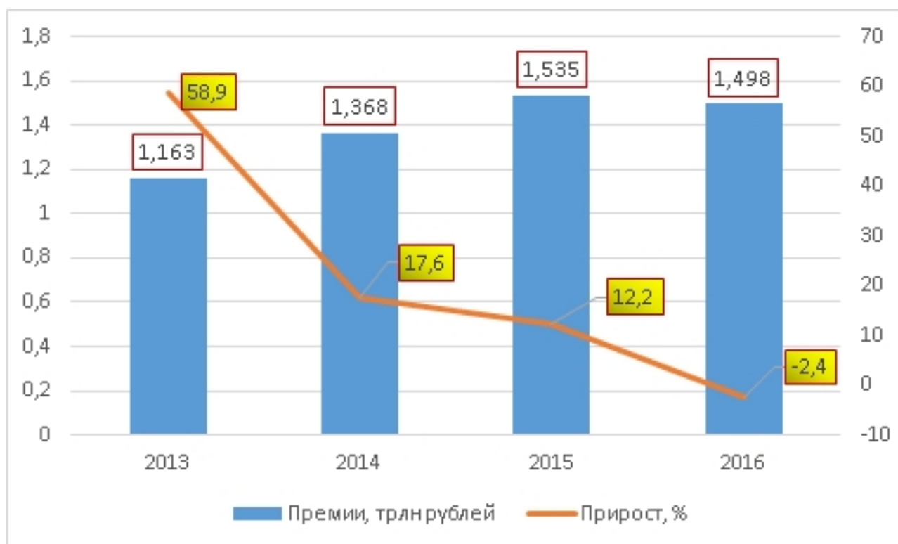
Рис. 1. Динамика прироста премий по ОМС в 2013–2016 гг.