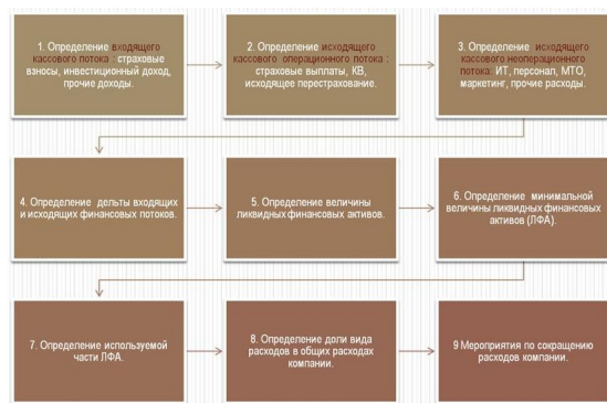
Рис. 7. Алгоритм определения финансовой «подушки безопасности»

Если эта разность отрицательная, то компания работает в минус и будет проедать живые ликвидные активы до тех пор, пока не обанкротится, или до тех пор, пока не найдет дополнительные финансовые ресурсы. Чтобы не обанкротиться в условиях минусовой дельты по входящим и исходящим потокам, компания должна сократить свои операционные и неоперационные расходы. Подробно алгоритм расчета «финансовой подушки безопасности» представлен на рис. 7.