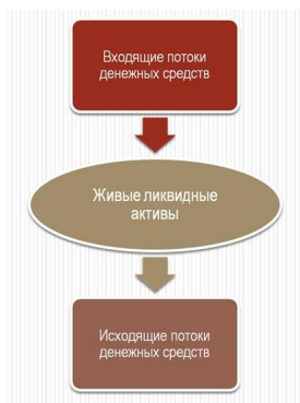
Рис. 5. Ключевые составляющие финансовой устойчивости

Итак, целью антикризисного управления в страховой компании является обеспечение ее финансовой выживаемости. Ключевыми же факторами этой финансовой выживаемости являются следующие: входящие финансовые потоки, живые ликвидные активы, исходящие финансовые потоки (рис. 5).