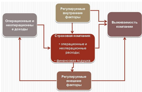
Рис. 1. Модель факторов кризиса

К основным слаборегулируемым внешним факторам относятся следующие: