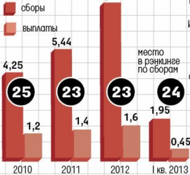
ПОКАЗАТЕЛИ МЕТЛАЙФ АЛИКО млрд руб.